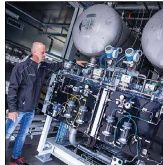
الکترولیزر در یک نیروگاه هیدروژنی کوچک