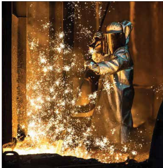
جریان آهن مذاب از کوره بلند کارخانه فولاد ThyssenKrupp Steel Europe در آلمان

یک عامل مهم در تعیین سرعت انتقال به هیدروژن پاک قیمت الکترولیزورها خواهد بود. سازمان‌های انرژی پیش‌بینی می‌کنند که تولید الکترولیزورها در