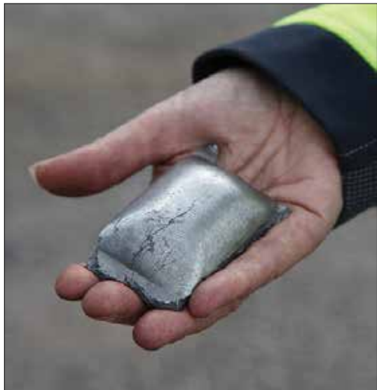
آهن اسفنجی، ماده خامی که فولاد از آن ساخته می‌شود. در کارخانه HYBRIT در لولتو در سوئد بدون استفاده از سوخت‌های فسیلی ساخته می‌شود

خطوط تولید کاملاً اتوماتیک، به جای تولید دستی، می‌تواند باعث کاهش سریع قیمت آن‌ها شود؛ کاهش تا بیش از دو-سوم قیمت فعلی تا سال ۲۰۳۰. به همین دلیل است که تحلیلگران پیش‌بینی می‌کنند هزینه ساخت هیدروژن سبز از حدود ۵ دلار بر کیلوگرم به ۱ دلار بر کیلوگرم در آینده افت می‌کند؛ حتی بدون یارانه‌هایی مانند قطع مالیات. به این ترتیب هیدروژن سبز رقیبی برای خاکستری می‌شود که در حال حاضر با قیمتی کمتر از ۱ دلار بر کیلوگرم تولید می‌گردد (اگر برخلاف اروپا، جنگ‌ها باعث افزایش قیمت گاز طبیعی نشوند). با این حال، چندین مطالعه پیش‌بینی می‌کنند که با افزایش تقاضا در دهه‌های آینده، بخش بزرگی از هیدروژن باید با هیدروژن آبی تأمین می‌شود.