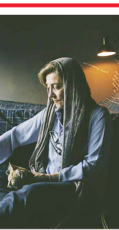
گفت و گو با کارگردان فیلم «همسایه شما، زهره»

پروانه نمایش داشت، تاکید شد که باید آن را دوساره ببینند البته در تهیات همه مسائل برطرف شد. وی درباره اینکه آیا خودش تصمیم گرفته فیلمش را در گروه هنر و تجربه ارکان کند گفت: اگرچه افواض سینما در گذشته هم چندان خوب نبود اما در همان سال ها برخی بخش کننده های می گفتند باوجود آنکه بازیگری به عنوان ستاره در فیلم نبست، باز هم می توان این فیلم را در سینمای بدنه ارکان کرد در حالی که آن شرایط سینما افکار تغییر کرده که به سستی می توان چنین فیلمی را در سینمای بدنه و کنار این تعداد کمدی ارکان کرد. از سوی دیگر گروه هنر و تجربه دو سالی است که از فیلم به پشتیبانی کرده و پیگیری های با رایت به ارکان رسیده است. فیلم انجام داده، به همین دلیل به گشتگری با کارشناسان مربوط، ارکان در این دسته و شرایط مناسب تر بود و من هم دوست داشتم فیلمم را روی پرده ببینم تا اینکه بتوانم آن را ارکان آنلین کنم.